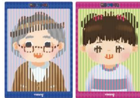
가족 그림 판